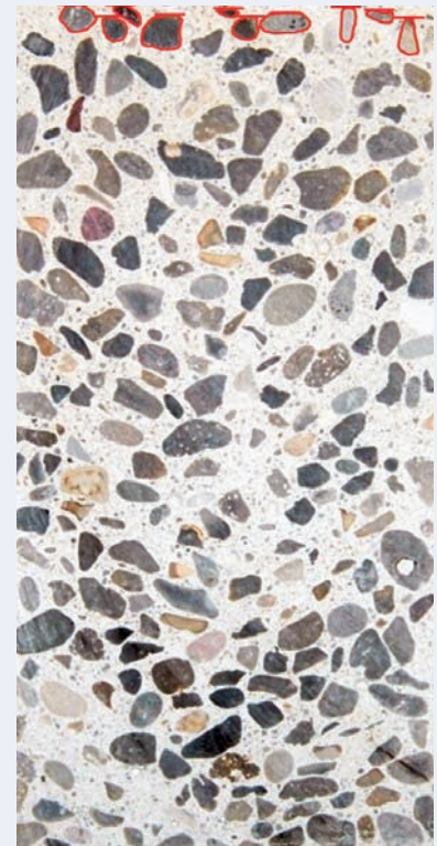
Abb. 2: SVB-Proben mit AALBORG WHITE®.

Dieser Durchschnittsabstand, geteilt durch die Gesamtlänge und multipliziert mit 100, ist die Segregation in Prozent.