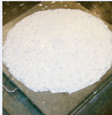
Abb. 1: SVB-Proben mit AALBORG WHITE®.

Links: Unveränderte Mischung (1:1-Austausch von grauem Zement mit AALBORG WHITE®).